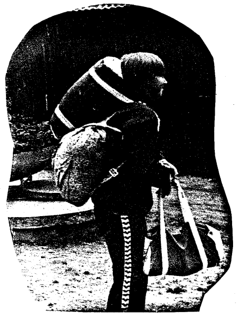
HOPPAS ATT JAG HAR ALLT MED MIG NU.